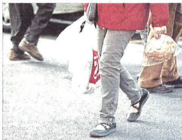
Una compra amb bosses d'un sol ús a la ciutat de Barcelona

ingereixen, de manera que entren a la cadena alimentària. Antonio Barrón, director de comunicació d'Ecoembes (entitat que finança i gestiona la recollida selectiva d'envasos lleugers amb el contenidor groc), destaca que l'usuari no distingeix aquests plàstics dels altres, i igualment van al contenidor groc, de vegades sense pagar la tarifa del punt verd. Barrón afegeix que aquestes bosses entorpeixen les operacions de reciclatge quan s'agrupen amb les bosses tradicionals de polietilè.●